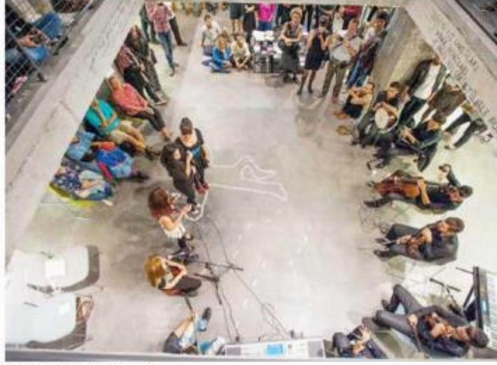
TANDEM'in Studio - X'teki son dönem sunumları.

sanatçı Bu kültür - sanat etkinlikleri TANDEM'in neresinde konuşuluyor?