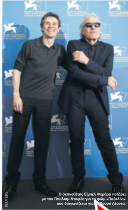
Ο σκηνοθέτης Εϊμπέλ Φεράρα ποζάρει με τον Γουίλιαμ Νταφόε για το φιλμ «Παζολίνι» που διαγωνίζεται για το Χρυσό Λέοντα.

Η παράλληλη εξομολόγηση του κόκκινου ημερολογίου του, που φημιολογείται ότι περιέχει κρίσιμες πληροφορίες για τις διασυνδέσεις εκπροσώπων της κυβέρνησης με το Νόβο Σαλβιατόρε Ρήνα, παραμένει μέχρι και σήμερα ένα μεγάλο μυστήριο. «Όλα τα στοιχεία είναι διασταυρωμένα, αλλά αυτό δεν σημαίνει ότι θα βρεθούν οι ένοχοι. Ποτέ δεν έγινε αυτό στη χώρα μου, ούτε πρόκειται», διαπιστώνει η Σαρμίνια Γκουτζάντι. ■