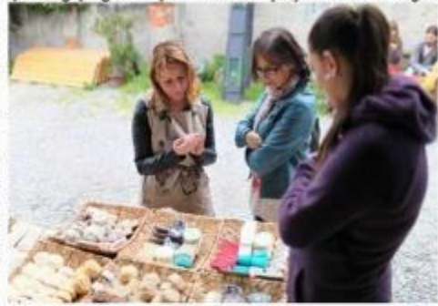
programda toplam 15 Tandem projesi ortaklığında yürütöüyor.

Anadolu Kültür'ün ortaklığında yürütölen TANDEM - Kültür Yöneticileri Değişim Türkiye Avrupa Birliği programı, Mart 2013'te Kültür ve Sanat alanında çalışan bireylere yapılan bir çağrı ile bařladı. Bu sene 2. dönemini gerçekleştirölen proje, Türkiye'den Ankara, Antalya, Artvin, Gaziantep, İstanbul, İzmir ve Sivrihisar toplam 15, Avrupa'dan ise Almanya, Belçika, Finlandiya, İngiltere, İspanya, İtalya, Macaristan, Polonya, Romanya, Slovakya ve Yunanistan'ın farklı şehirlerinden 17 kişi ve kurumı alıyor. Program 1,5 sene boyunca sürecek çalışmaları tüm süreçlerini anlatan ve pekişöden örnekler sunan bir sergi ile tamamlanacak. Eđim öđne kadra farklı etkinliklerle devam edecek olan