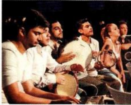
Roma musicians perform during a concert as part of the Bir Arada-Tandem Orchestra project in this undated file photo.