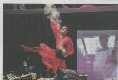
► Scena z „Carycy Katarzyny”

Historia tańca rumuńskiego... Czy w ogóle jest coś takiego? W trakcie dotychczasowych siedemnastu odsłon Międzynarodowych Spotkań Teatrów Tańca tylko raz - w 2007 roku - gościliśmy w Lublinie zespoły z Rumunii. I nie były to prezentacje, które jakoś szczególnie zapisały się w kronikach lubelskiego festiwalu. Czy więc realizacja Manuela Pelmusa traktuje o bycie nieistniejącym? A może to my patrzmy na to zjawisko z niewłaściwej perspektywy? Może historie, które oficjalnie nie ma, można jednak zrekonstruować i opisać? Przynajmniej, że z ciekawością czekam na odpowiedź na te pytania i myślę, iż w owym oczekiwaniu nie jestem osamotniony. 19.10, godz. 21, Centrum Kultury; bilety - 20/10 zł